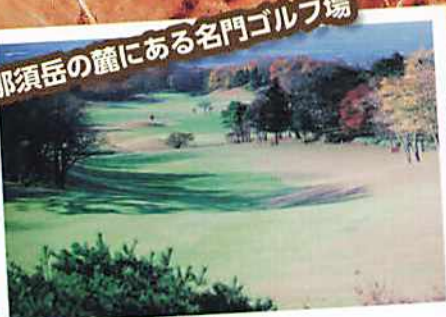
那須ゴルフ倶楽部