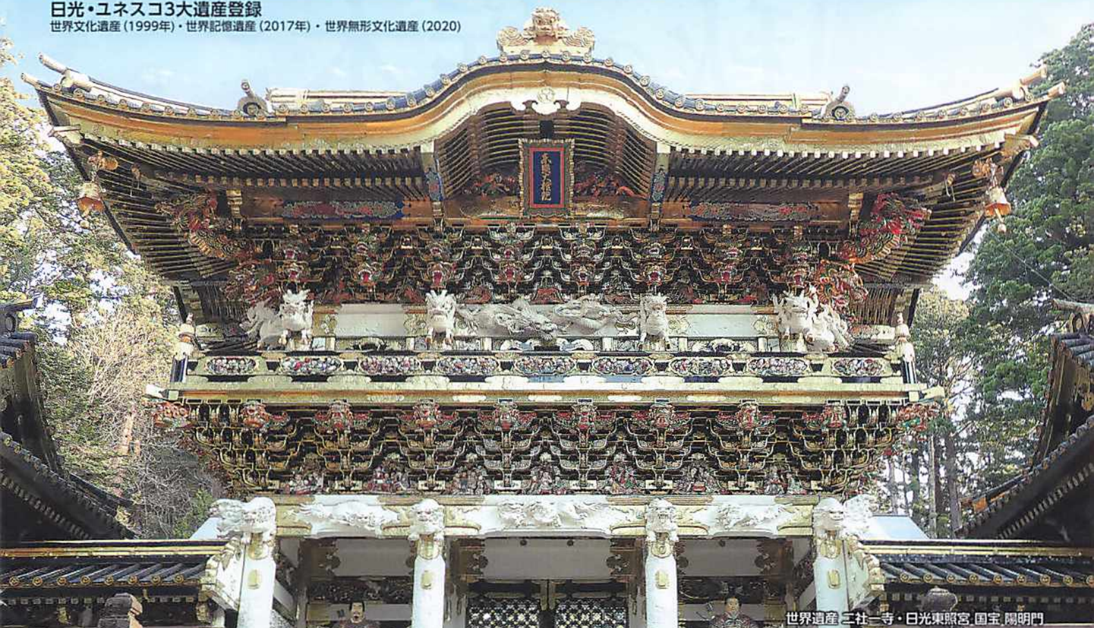
世界遺産 三社一寺・日光東照宮 国宝 陽明門

世界文化遺産(1999年)・世界記憶遺産(2017年)・世界無形文化遺産(2020)