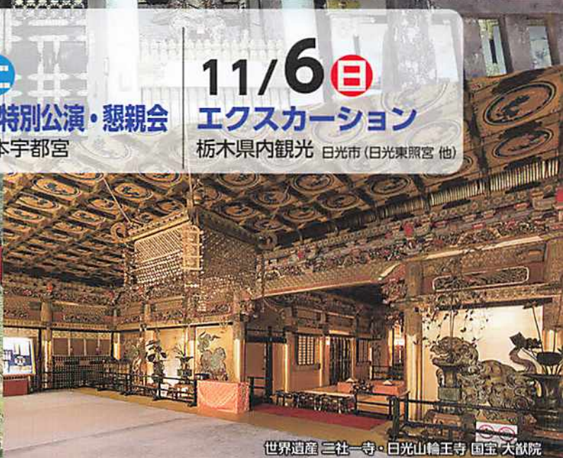
世界遺産 三社一寺・日光山輪王寺 国宝 大猷院