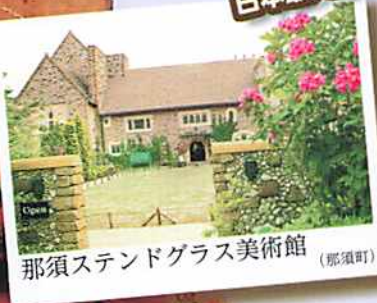
那須ステンドグラス美術館