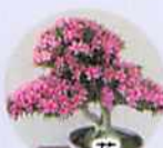
花 (さつき・西洋あじさい)