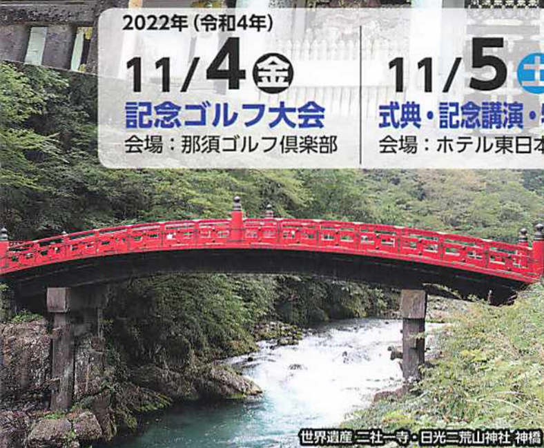
世界遺産 三社一寺・日光三荒山神社 神橋