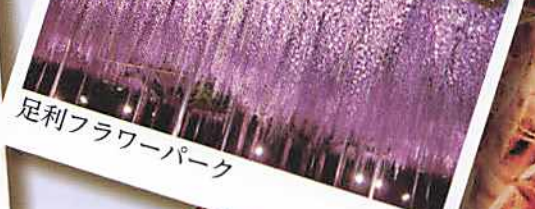
足利フラワーパーク