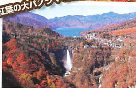
中禅寺湖と華厳の滝 (日光国立公園)