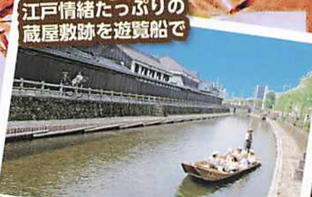
巴波川 (うずまがわ)